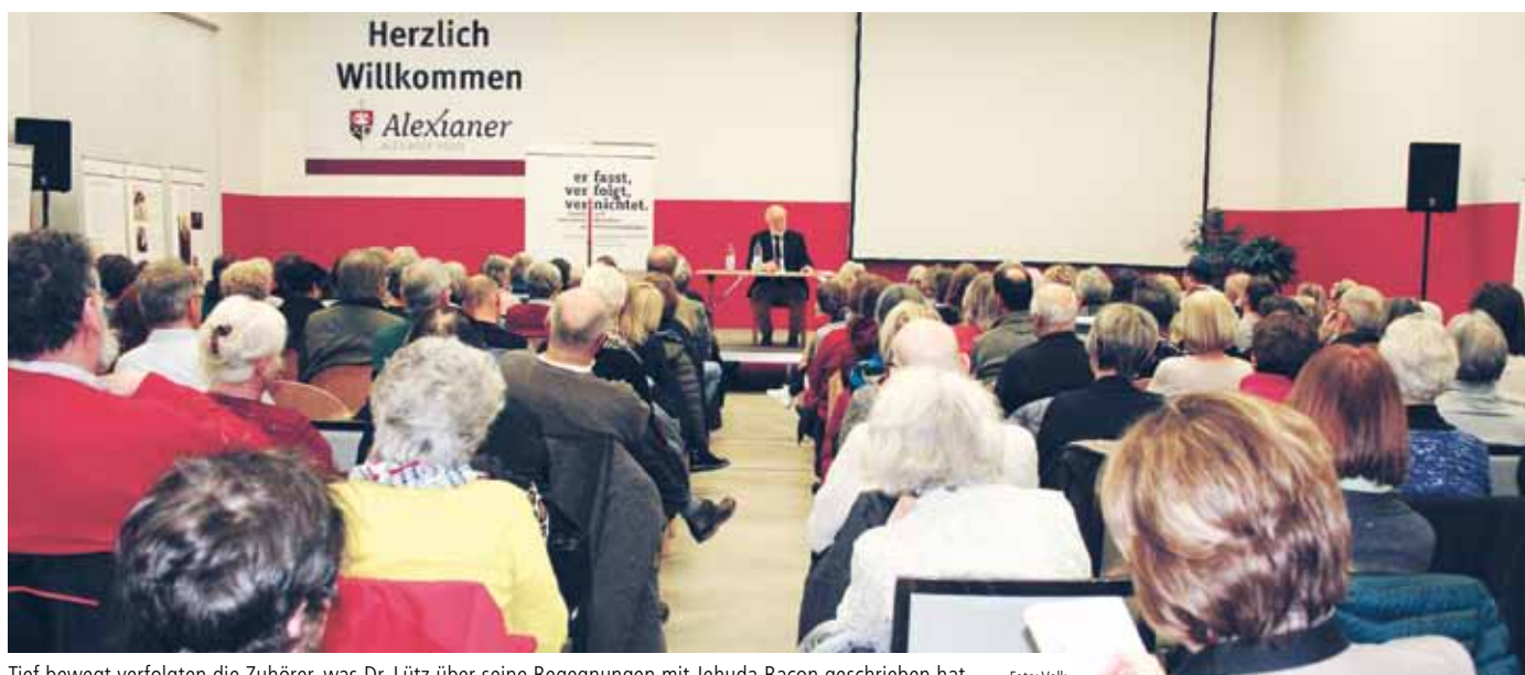
Tief bewegt verfolgten die Zuhörer, was Dr. Lütz über seine Begegnungen mit Jehuda Bacon geschrieben hat

Eindrucksvolle Buchlesung mit Dr. Manfred Lütz