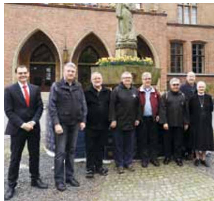
Im Innenhof des Alexianer St. Hedwig-Krankenhauses

Am Nachmittag stand das Alexianer Krankenhaus Hedwigshöhe auf dem Programm. Nach einem gemeinsamen Kaffeetrinken mit Vertretern der Hausleitung, der Seelsorge und den Chefärzten, in dem die Brüder durch zahlreiche Fachfragen ihr Interesse zum Ausdruck brachten, schloss sich eine Hausbesichtigung an, die mit einem gemeinsamen Vaterunser in der Krankenhauskapelle endete.