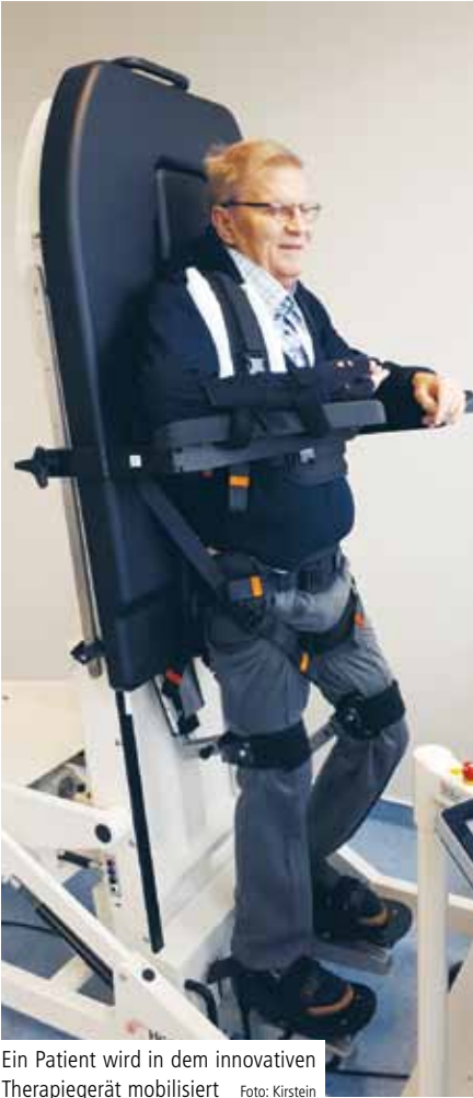
Ein Patient wird in dem innovativen Therapiegerät mobilisiert.

Augustahospital testet innovatives Therapiegerät