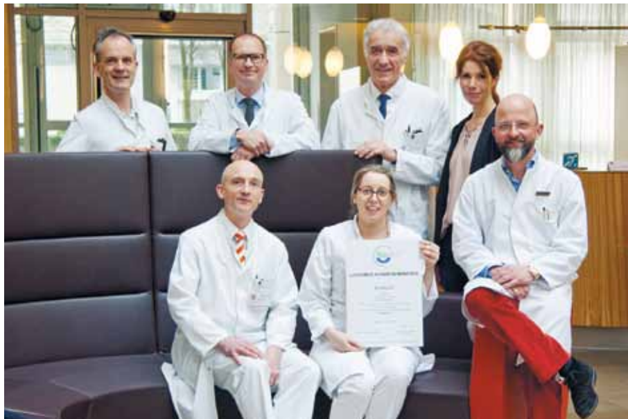
Experten des Clemenshospitals und der Raphaelsklinik haben sich zum Kontinenz- und Beckenbodenzentrum zusammengeschlossen, das jetzt erfolgreich zertifiziert wurde