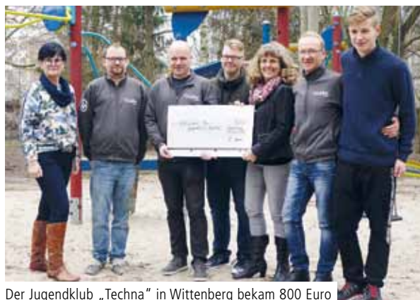
Der Jugendklub „Techna“ in Wittenberg bekam 800 Euro für eine neue Wippe und eine Ballsportanlage