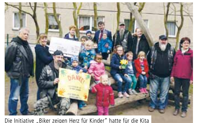
Die Initiative „Biker zeigen Herz für Kinder“ hatte für die Kita Wirbelwind in Dessau 800 Euro eingeworben