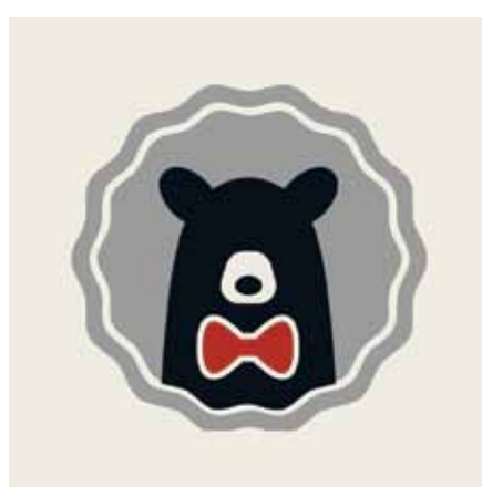
Der Berliner Bär ziert das Logo von „Verwackelt in Berlin“

Parkinsonbetroffene zu Wort kommen zu lassen, die – trotz ihrer Erkrankung – etwas bewegen und gleichzeitig die unterschiedlichen Akteure im Bereich Parkinson optimal zu vernetzen, das ist das erklärte Ziel der Veranstaltungsreihe