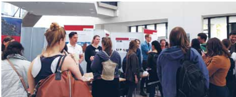
Reges Interesse an einem PJ in den Alexianer St. Hedwig Kliniken bei der PJ-Einführungsveranstaltung der BKG

Für Medizinstudenten ist das Praktische Jahr (PJ) die letzte Möglichkeit vor dem Examen, um praktische Erfahrungen zu sammeln. Als Akademische Lehrkrankenhäuser der Charité verfügen die Alexianer St. Hedwig Kliniken über ein breites somatisches und psychiatrisches Ausbildungsspektrum.