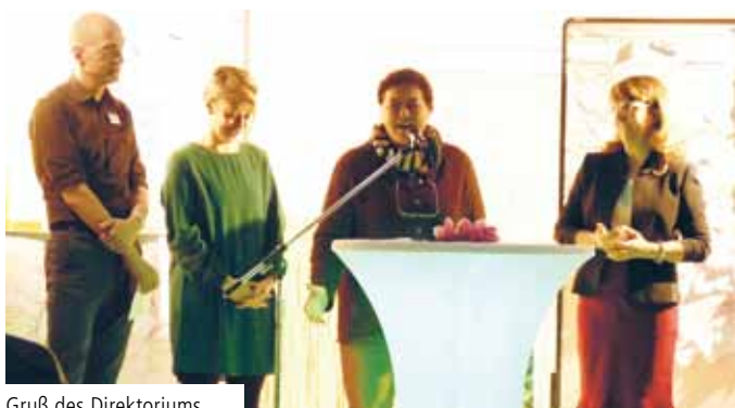
Grüß des Direktoriums