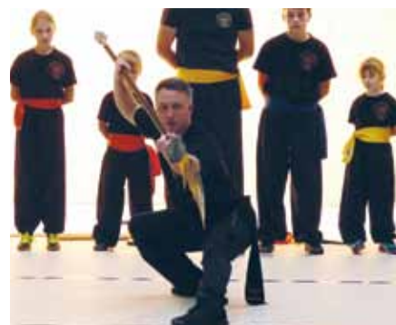
Kampfkunst im St. Joseph-Krankenhaus Dessau