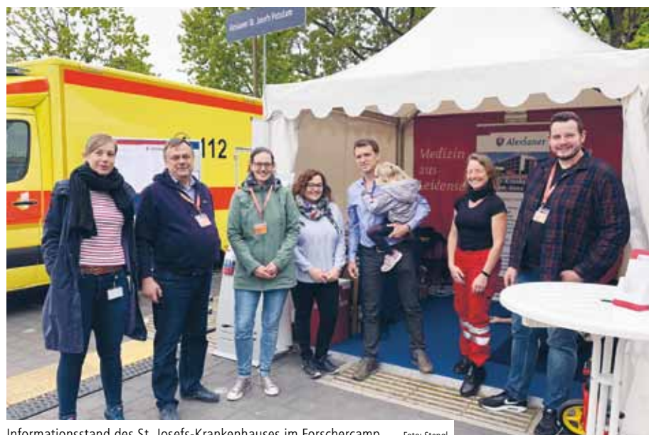
Informationsstand des St. Josefs-Krankenhauses im Forschercamp

Tausende Potsdamerinnen und Potsdamer sowie Besucher der Landeshauptstadt strömten am 11. Mai 2019 zum siebten Potsdamer Tag der Wissenschaften. Neugier wecken, Kompliziertes erklären und mit Fakten überzeugen – das war das Motto der über 30 ausstellenden Forschungseinrichtungen Brandenburgs, die sich auf dem Campus der Fachhochschule Potsdam an der Kiepenheuerallee präsentierten.