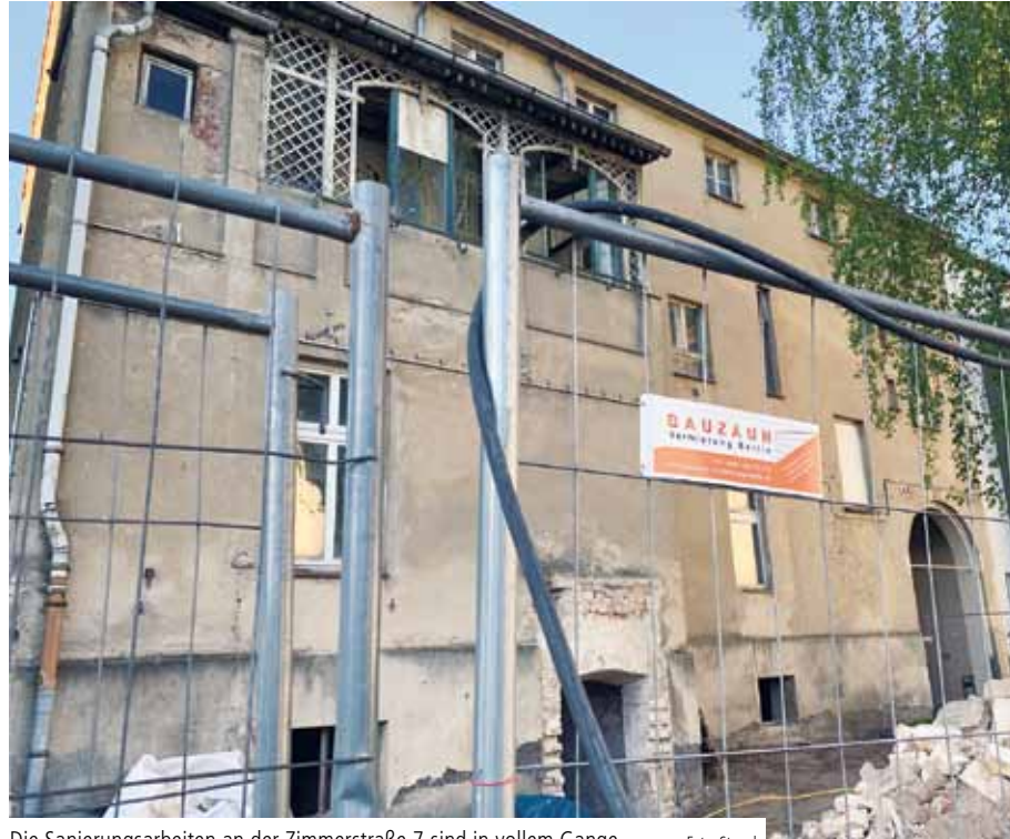
Die Sanierungsarbeiten an der Zimmerstraße 7 sind in vollem Gange

„Es war schon immer unser Wunsch, alle Dienste – gern erweitert mit einer Dependance der Sozialstation – unter einem Dach zu einem sozialen Beratungszentrum zu vereinen“, sagt Angela Schmidt-Fuchs, die Beauftragte des Caritasverbandes für die Landeshauptstadt Potsdam und den Landkreis Potsdam-Mittelmark. „Das Pfarrhaus platzt mit uns auch aus allen Nähten – wir brauchen dringend mehr Platz.“ Schon eine ganze Weile habe