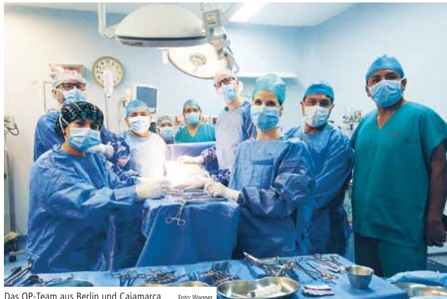
Das OP-Team aus Berlin und Cajamarca