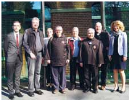
Vor dem Hauptportal des Alexianer St. Joseph-Krankenhauses

Bruder Lawrence Krueger, der Generaloberer der Ordensgemeinschaft der Alexianerbrüder, besuchte zusammen mit Mitbrüdern am 4. und 5. April 2019 die drei Berliner Standorte