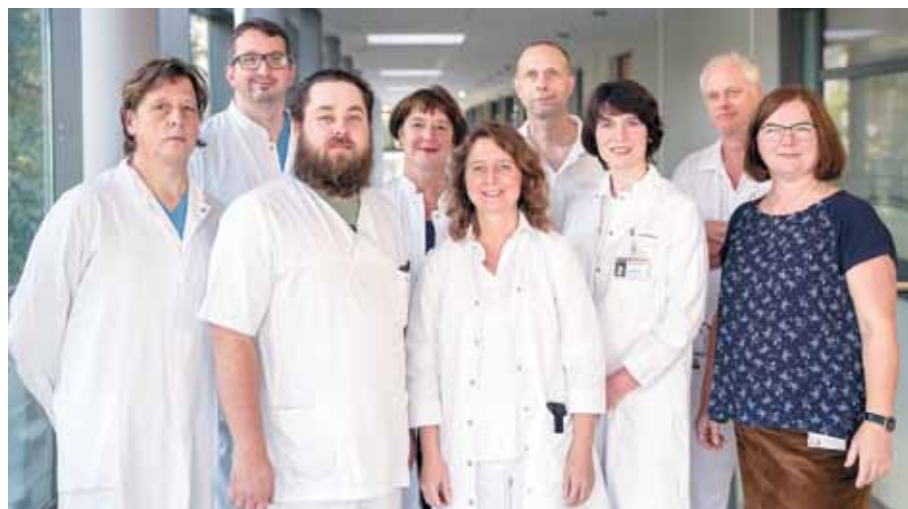
Gelebte interdisziplinäre Zusammenarbeit im Gefäßzentrum am St. Josefs-Krankenhaus Potsdam

Trotz Implementierung neuer operativer und interventioneller Techniken ist die Zahl der Amputationen leider steigend. Individuelle Therapiekonzepte sind gefragt und die enge Zusammenarbeit zwischen Ambulanz und Klinik ist eine der wichtigen Säulen der Therapie. Die Verzahnung der Professionen im stationären Set-