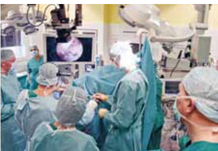
Während die Operateure in der Raphaelsklinik konzentriert das Schultergelenk des Patienten behandeln, werden die Bilder live ins Mövenpick übertragen

Rege Teilnahme am OP-Workshop der Schulterchirurgie