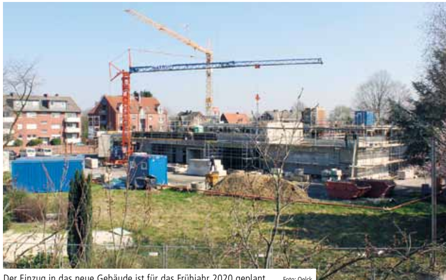
Der Einzug in das neue Gebäude ist für das Frühjahr 2020 geplant

Die Altbauten weichen neuen und modernen Gebäuden, die allen Anforderungen gerecht werden. „Ein offenes und buntes Gelände ist unser Ziel“, erklärt Christian Lohmann, der sich auf die Veränderungen freut.