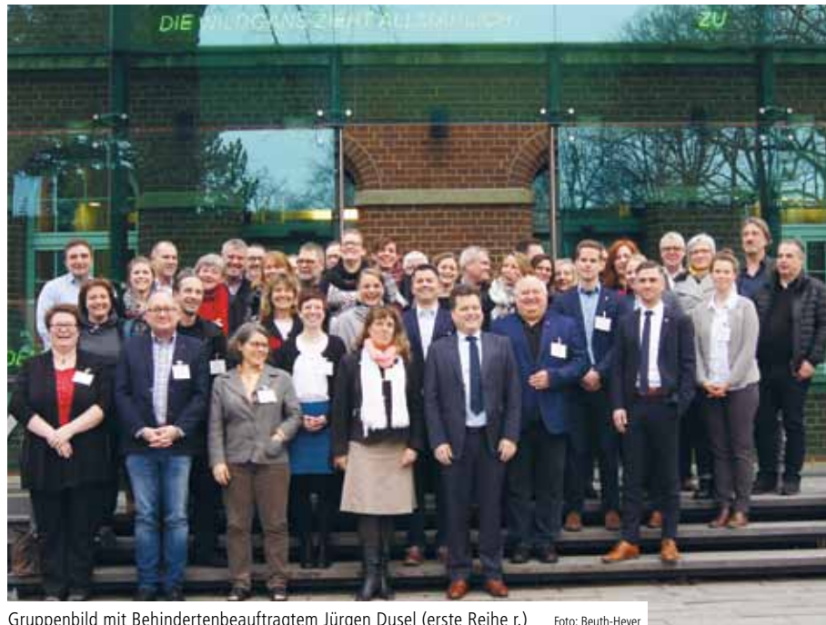
Gruppenbild mit Behindertenbeauftragtem Jürgen Dusel (erste Reihe r.)

In seiner Rede bezog sich Dusel auf die am gleichen Tag erwartete „bahnbrechende“ Entscheidung des Bundesverfassungsgerichtes zum Wahlrecht für Menschen, die unter Vollbetreuung stehen. Deren Ausgrenzung sei viele Jahrzehnte lang geltendes Recht gewesen. Dusel beschrieb sein interministerielles Bemühen darum, das diesem Recht zugrundeliegende anachronistische Menschenbild zu korrigieren. Dies ginge davon aus, dass Menschen,