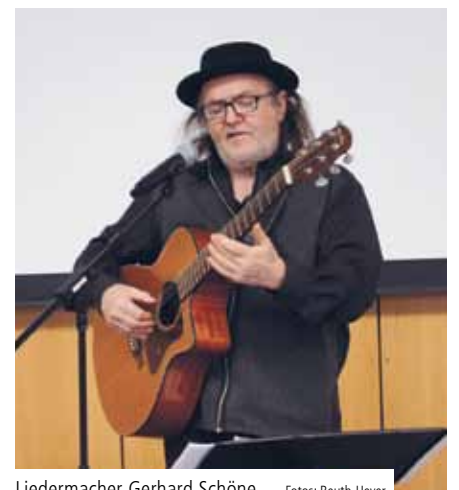
Liedermacher Gerhard Schöne