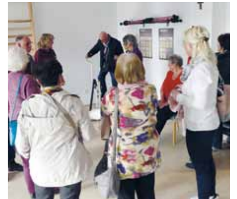
In der Physiotherapie ließen sich Geräte ausprobieren

Marika Höse Presse- und Öffentlichkeitsarbeit Klinik Bosse Wittenberg