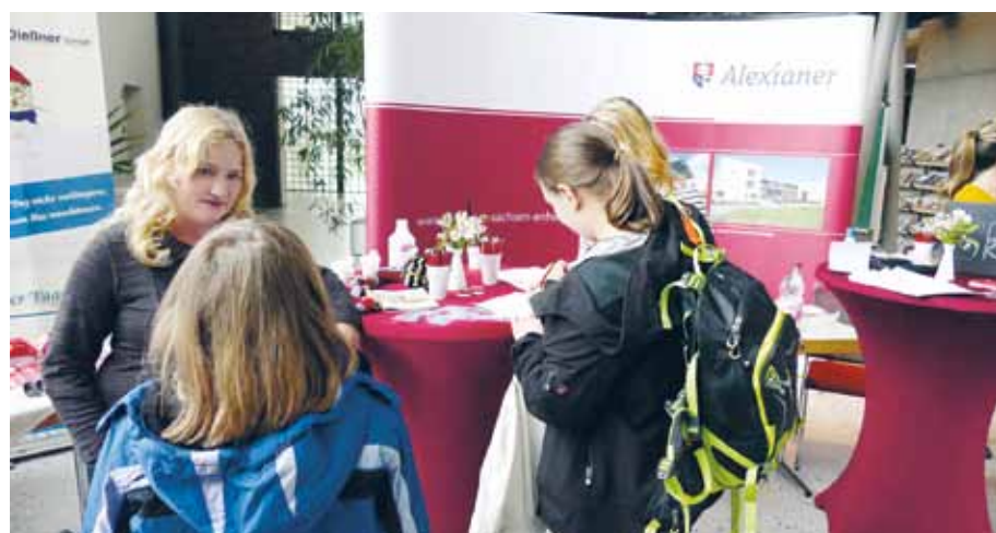
Wie sieht die Pflege in einem psychiatrischen Krankenhaus aus? Antworten gab es am Alexianer-Stand