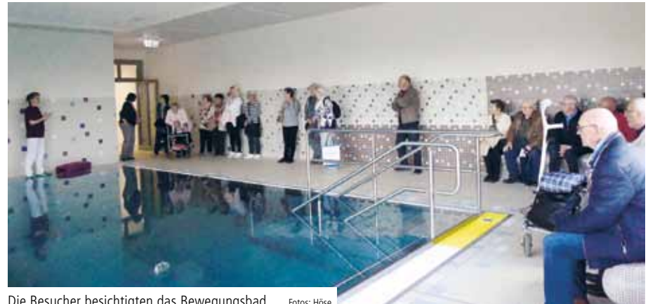
Die Besucher besichtigten das Bewegungsbad