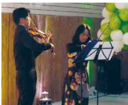
Asiatische Klänge ertönten