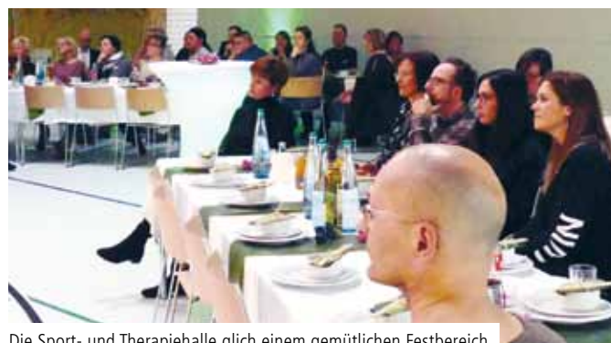
Die Sport- und Therapiehalle glich einem gemütlichen Festbereich