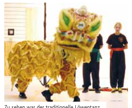
Zu sehen war der traditionelle Löwentanz