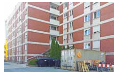
Noch stehen Bau-Container vor dem Wohnheim an der Piusallee, im September wird das Projekt dann abgeschlossen sein.

Das fünfgeschossige Gebäude aus dem Jahr 1972 war deutlich in die Jahre gekommen. Nicht nur die 110 Zimmer mussten renoviert werden, auch die komplette Installationstechnik und das Dach wurden saniert, die Fenster isoliert, es gab komplett neue Bäder und die Aufzugsanlage wurde ausgetauscht. „Die Zufriedenheit der Mitarbeiterinnen und Mitarbeiter ist