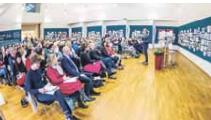
Volles Haus beim Vortrag im Kunsthaus Kannen

Don-Bosco-Symposium begrüßte zahlreiche Gäste