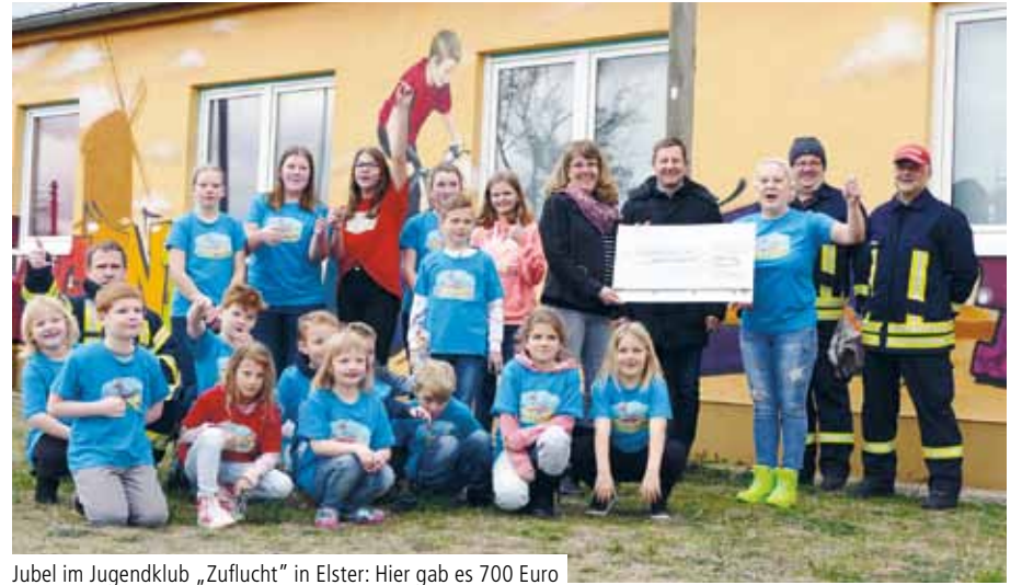
Jubel im Jugendklub „Zuflucht“ in Elster: Hier gab es 700 Euro für das achte Elsteraner Kinderzeltlager

Marika Höse, Presse- und Öffentlichkeitsarbeit Klinik Bosse Wittenberg