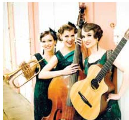
Die Zucchini Sistaz

Seitdem jagt eine Aktion die nächste: Golfturniere, Weinverkauf, Keksdosen, Adventskalender – den Lions gehen die Ideen nicht aus. Als Highlight für 2019 steht eine Benefizgala im GOP-Theater mit den Zucchini-Sistaz auf dem Programm und 2020 folgt ein symphonisches Konzert mit einem bekannten Solisten. Am Ende soll eine sechstellige Spendensumme stehen, mit der, so ein erster Gedanke, vielleicht die Einrichtung der Appartements im Pelikanhaus finanziert wird.