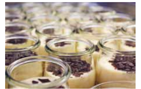
Hübsch anzusehen und begehrt: Die kleinen Dessertgläser aus dem Roncalli-Haus