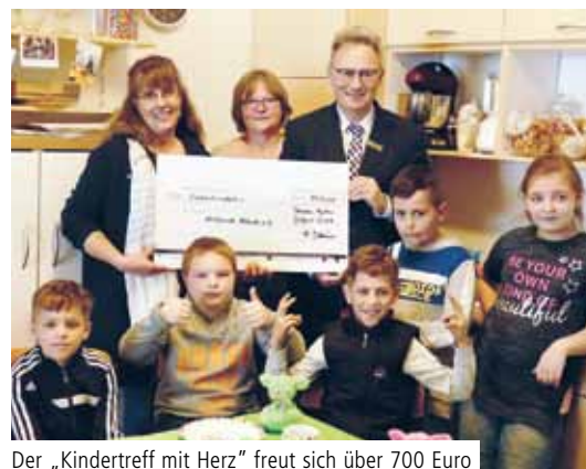
Der „Kindertreff mit Herz“ freut sich über 700 Euro für einen gesunden Kochkurs