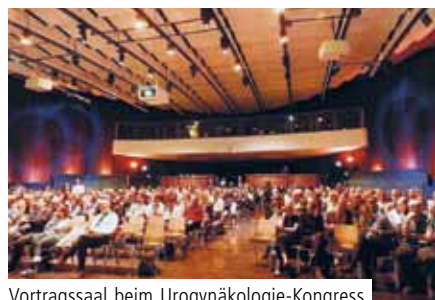
Vortragssaal beim Urogynäkologie-Kongress

BERLIN. Am 22. und 23. März 2019 haben Experten aus den Bereichen Frauenheilkunde, Urologie und Physiotherapie im ehemaligen Berliner Kino Kosmos am Deutschen Urogynäkologie-Kongress teilgenommen.