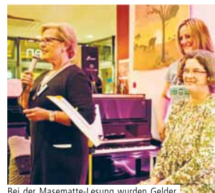
Bei der Masematte-Lesung wurden Gelder für den Palliativverein gesammelt.

Das Geld fließt eins zu eins in die Station, alle arbeiten komplett ehrenamtlich. Von den Geldern kauft Marbach regelmäßig Bücher und Spiele. Aber auch größere Anschaffungen wurden getätigt: Ein E-Piano für den Aufenthaltsraum zum Beispiel. Und