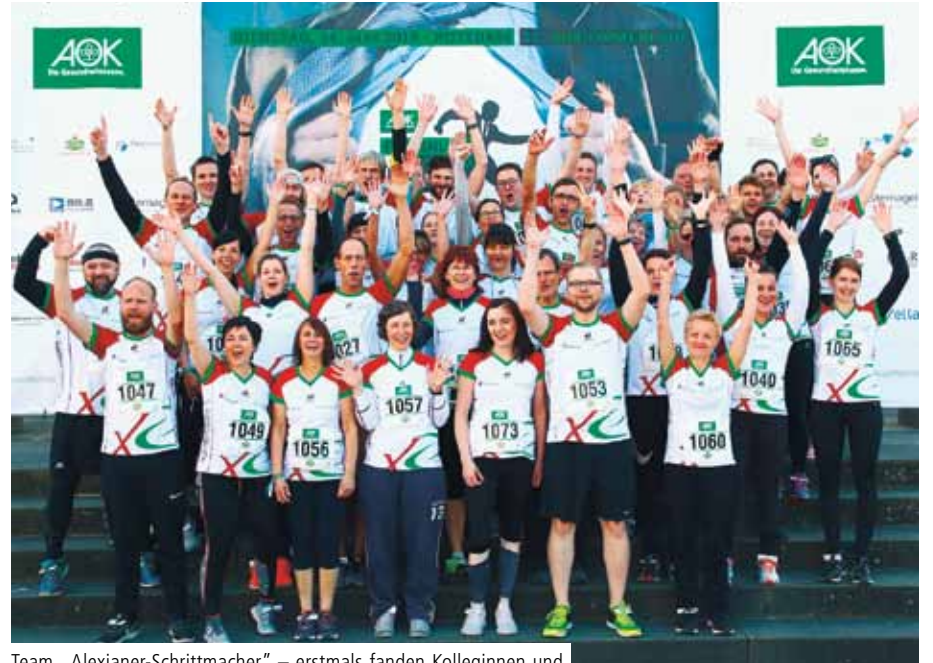
Team „Alexianer-Schrittmacher“ – erstmals fanden Kolleginnen und Kollegen aller Einrichtungen der Region zusammen

Erstes großes sportliches Highlight war der Potsdamer Firmenlauf mit mehr als 4.000 Läuferinnen und Läufer aus knapp 300 regionalen Unternehmen im