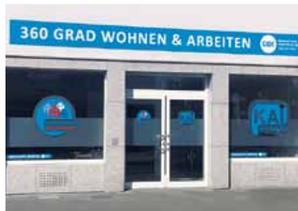
Neue Räume für ambulante Dienste

Am 4. Februar 2019 haben die beiden ambulanten Dienste des Verbundunternehmens der Alexianer Werkstätten GmbH, der Gemeinnützigen Werkstätten Köln (GWK) „Köln arbeitet inklusiv“ und Betreutes Wohnen (BeWo), ihre neuen Räume in der Longeicher Straße 441 bezogen.