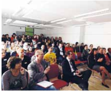
Gäste und Auszubildende bei der Schulraumeinweihung

Anlässlich der Schulraumeinweihung wurde auch die Wanderausstellung „Walk of Care“ präsentiert. Zwei Azubis der Akademie, die aktiv den Berliner Pflegestammtisch unterstützen, haben die Ausstellung auf die Beine gestellt. Zwei Lehrerinnen unterstütz-