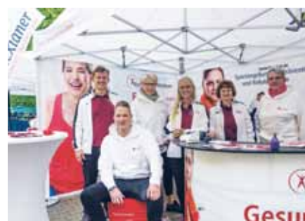
Gute Laune am Infostand der Alexianer

Auch außerhalb der Laufstrecke hatte der Apfelblütenlauf wieder einiges zu bieten. Das jährliche Ereignis ist längst zum Volksfest geworden. Neben dem Rahmenprogramm gab es auch in diesem Jahr wieder ein Informationsangebot der ortsansässigen Firmen. Da durften die Alexianer als großer Gesundheitsanbieter vor Ort nicht fehlen. KreVital – Institut für Gesundheitsförderung informierte über Sportangebote und massierte müde Sportler-