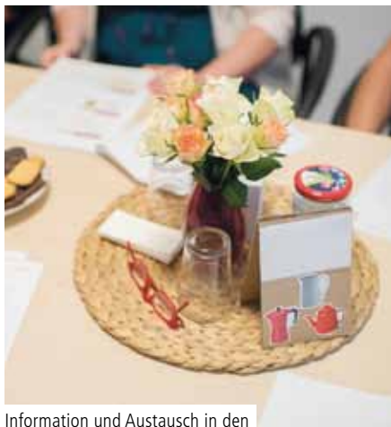
Information und Austausch in den Gesprächskreisen