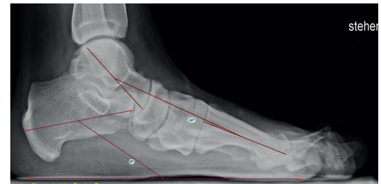
Knick-Senkfuß vor operativer Korrektur