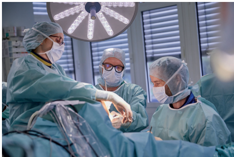
OP im Clemenshospital

Im fußchirurgischen Zentrum am Clemenshospital behandeln wir das gesamte Erkrankungs- und Verletzungsspektrum der Füße.